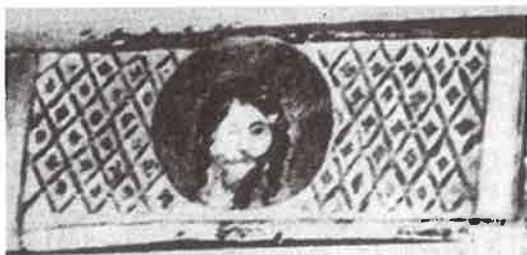
Représentation ancienne du Mandylion (fresque). Antique fresco of the Mandylion.

Il se présentait à peu près de la manière suivante.