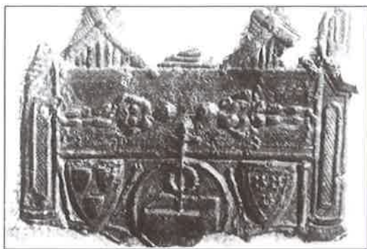
Méreau retrouvé dans la Seine. Lead medal found in Seine river.

Un indice de cette affluence a été retrouvé au siècle dernier par un pêcheur de trésors, Forgeais, tout près d'ici, dans la Seine, près du Pont-au-Change :