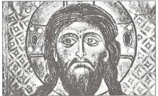
Fresque de Spas Neredita (1199). Spas Neredita fresco (1199).

Tout d'abord l'iconographie du Christ change complètement à partir de la redécouverte du Mandylion au 6ème siècle. Du jeune homme aux cheveux courts et bouclés représenté dans les catacombes, on passe au sémite aux cheveux longs et à la barbe qui représentera universellement le Christ désormais.