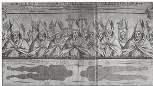
Ostension de 1578 (Saint Charles Borromée est au centre). 1578 exposition, (St Charles Borromée appears in the middle)

Les évêques de Turin élèvent alors par trois fois le Linceul pour le présenter à la foule. Il est ensuite transporté à la cathédrale où l'adoration se poursuivra.