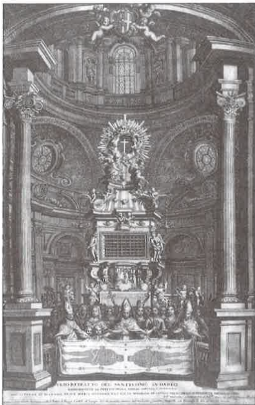
Ostension de 1703. 1703 exposition.

Ladies and Gentlemen, in our times, which are a bit difficult for Christians, Christ has wanted to encourage us especially by leaving us his own photograph.... Do we realise how lucky we are?